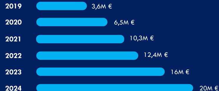
Évolution du CA depuis 2019 (en millions d'euros)